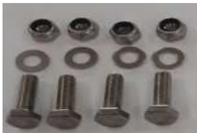
Viti passo 2