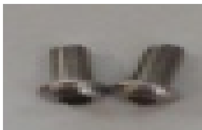
Viti passo 4